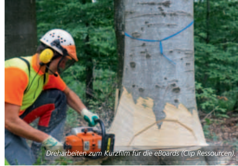
Dreharbeiten zum Kurzfilm für die eBoards (Clip Ressourcen).