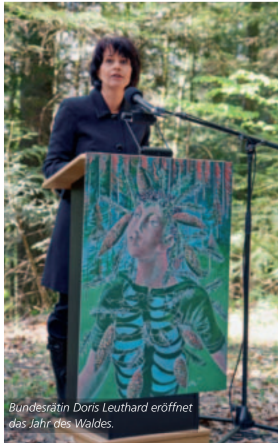
Bundesrätin Doris Leuthard eröffnet das Jahr des Waldes.