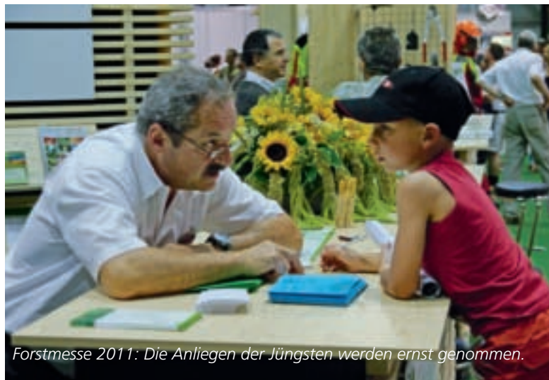
Forstmesse 2011: Die Anliegen der Jüngsten werden ernst genommen.