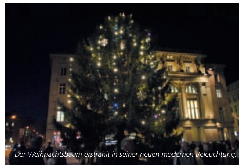
Der Weihnachtsbaum erstrahlt in seiner neuen modernen Beleuchtung.