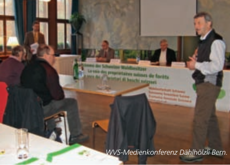
WVS-Medienkonferenz Dählhölzli Bern.