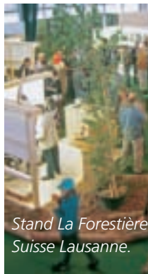
Stand La Forestière Suisse Lausanne.