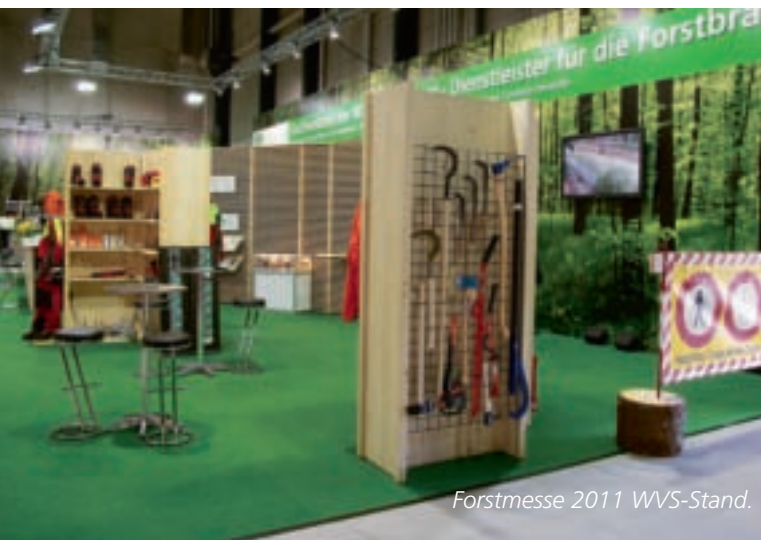
Forstmesse 2011 WVS-Stand.