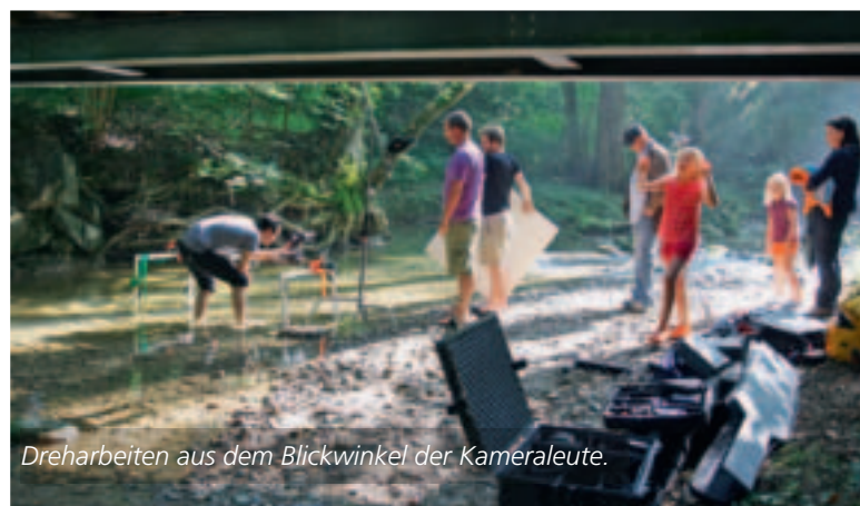
Dreharbeiten aus dem Blickwinkel der Kameraleute.