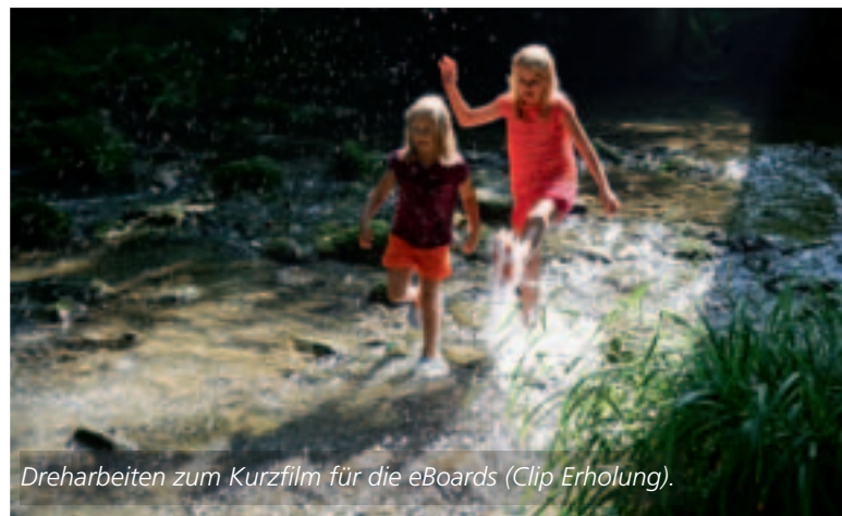
Dreharbeiten zum Kurzfilm für die eBoards (Clip Erholung).