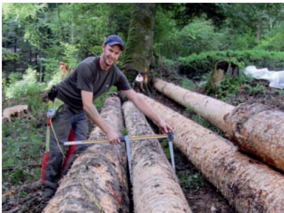
Einmessen mit Kluppe und Messband.

Im Herbst 2012 kann aktiv mit der Einführung der erneuerten ForstBAR 3.0 begonnen werden. Im IT-Umfeld wird damit gerechnet, dass im Sommer/Herbst 2012 Windows 8 auf den Markt kommt. Die von WVS-Ökonomie vertriebenen Programme werden deshalb ausführlich auf ihre Kompatibilität getestet, um unliebsame Überraschungen zu vermeiden.