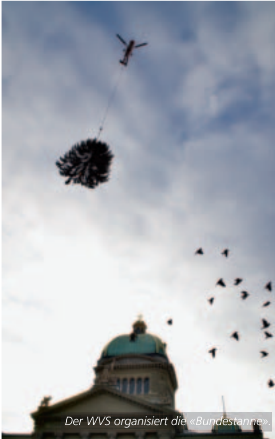
Der WVS organisiert die «Bundestanne».