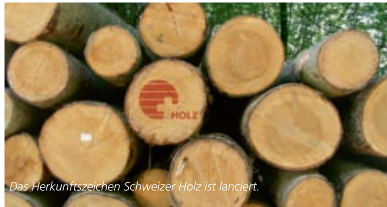
Das Herkunftszeichen Schweizer Holz ist lanciert.