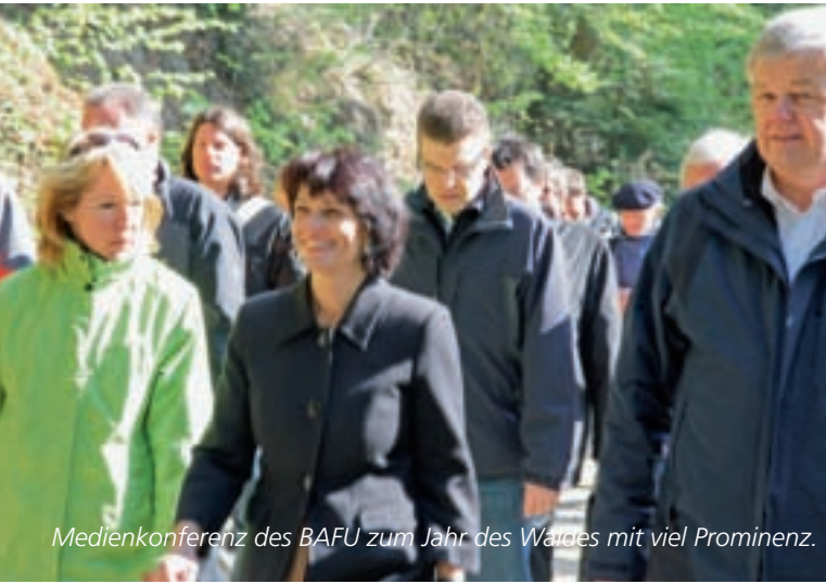
Medienkonferenz des BAFU zum Jahr des Waldes mit viel Prominenz.