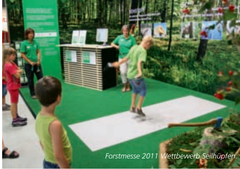
Forstmesse 2011 Wettbewerb Seilhüpfen.