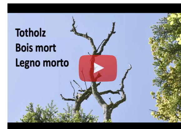
Ein kurzer Sensibilisierungsfilm wird vom KWF ausgezeichnet.

Durch die Neugliederung der Kursgruppen sind die einzelnen Positionen nur bedingt mit dem Vorjahr vergleichbar. Auf den positionsweisen Vergleich wird deshalb verzichtet. Zum Vergleich: 2015 wurden in 468 Kursen 4235 Teilnehmer ausgebildet.