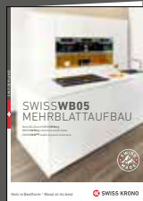
SWISSWB MEHRBLATTAUFBAU STRATIFIÉ DIRECT SWISSWB SWISSWB-STRUTTURA MULTI-LAMA SWISSWB-MULTI-LAYERED-STRUCTURE