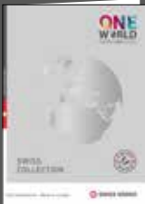
ONE WORLD SWISS COLLECTION