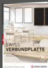
VERBUNDPLATTEN PANNEAUX COMPOSITES PANNELLI COMPOSITI LAMINATE BONDED BOARDS

SWISS KRONO-Welt | L'univers SWISS KRONO | Mondo SWISS KRONO | SWISS KRONO-World